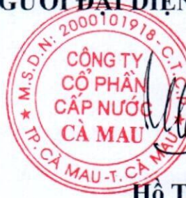
Hồ Tấn Luật Chủ tịch Hội đồng quản trị